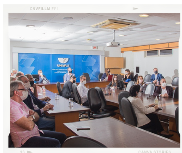
Evento para formadores de opinião