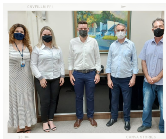
Reunição com a gerência do Grupo Unità

Além disso, realizamos outras reuniões com empresários de Itajaí, buscando apoio institucional e financeiro para o Fundo Patrimonial Amigos da Univali.