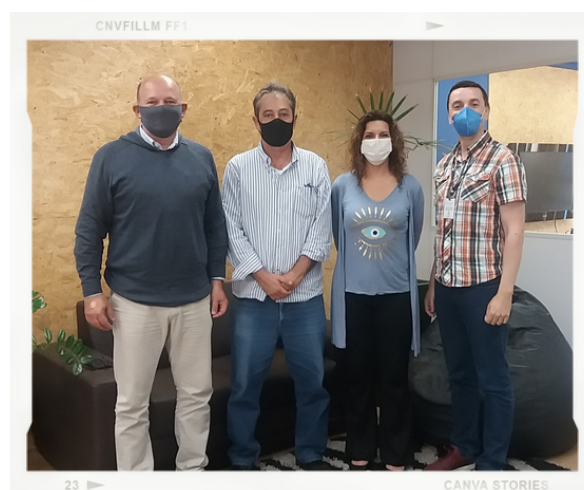
Encontro com a doador